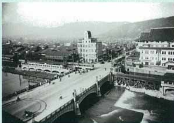
黒川翠山撮影写真（京都府立総合資料館所蔵）