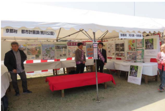
京都府鴨川条例等の啓発