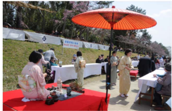
お茶席:二條流社中