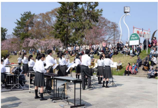
ふれあい広場(洛北高等学校)