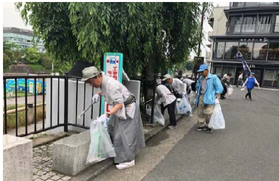
三条大橋ゲート付近清掃