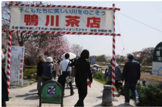
会場北入口(北山大橋東南)