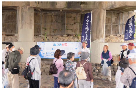
三条大橋右岸清掃活動後 門川市長挨拶