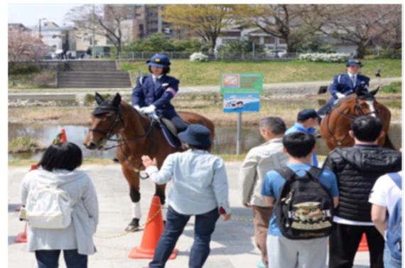
ふれあい広場(府警平安騎馬隊)