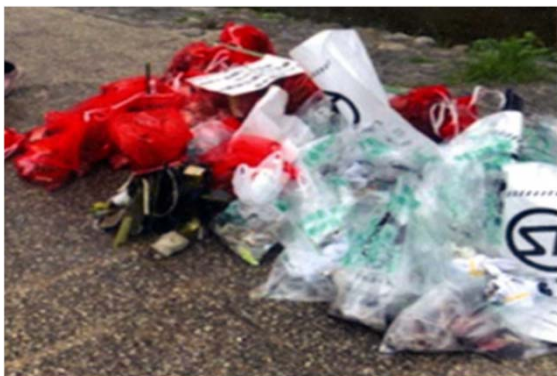
河床清掃のゴミ集積