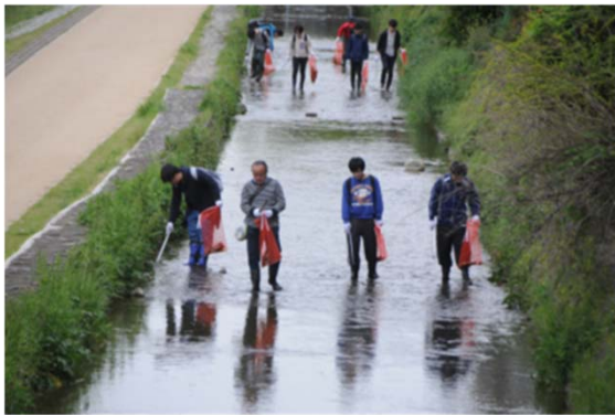
みそそぎ川の河床清掃