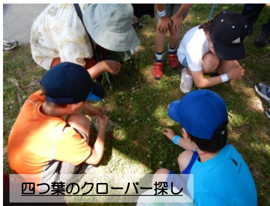
四つ葉のクローバー探し