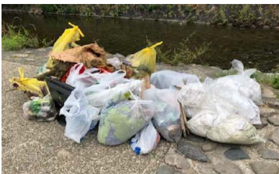
ゴミの集積(三条大橋)