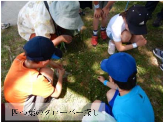
四つ葉のクローバー探し