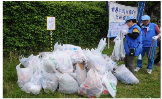
ゴミの集積(丸太町橋北)