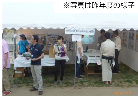
※写真は昨年度の様子