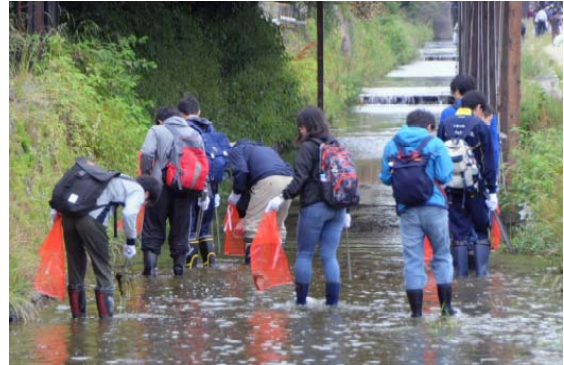
みそそぎの河床清掃