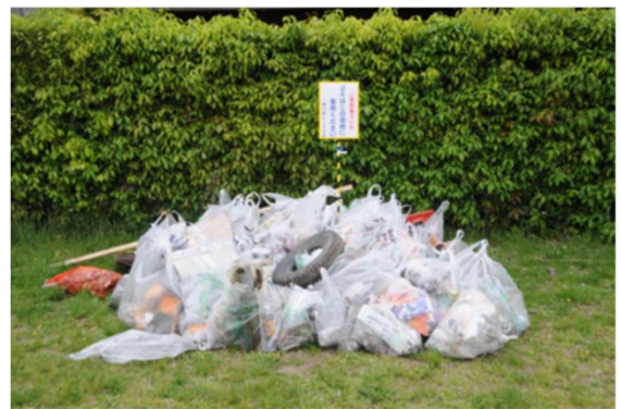
ゴミの集積(丸太町橋北)