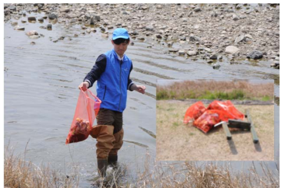
河床清掃担当スタッフ