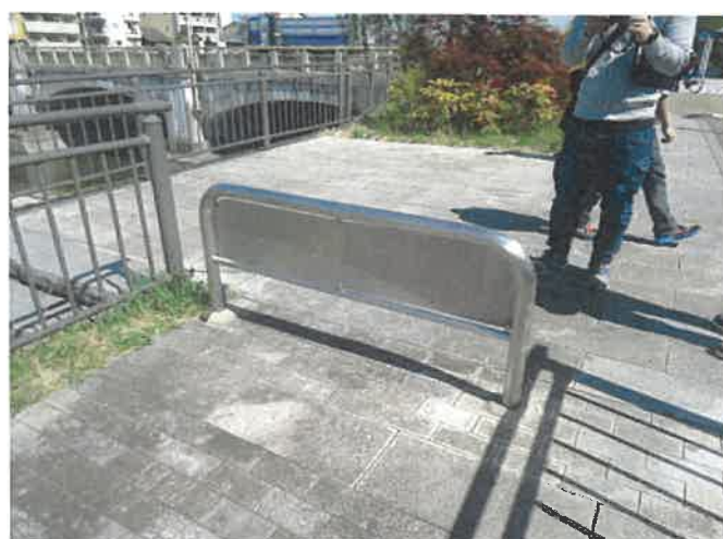
鴨川条例規制看板(自動車等の乗入れ禁止) (同一箇所の写真)