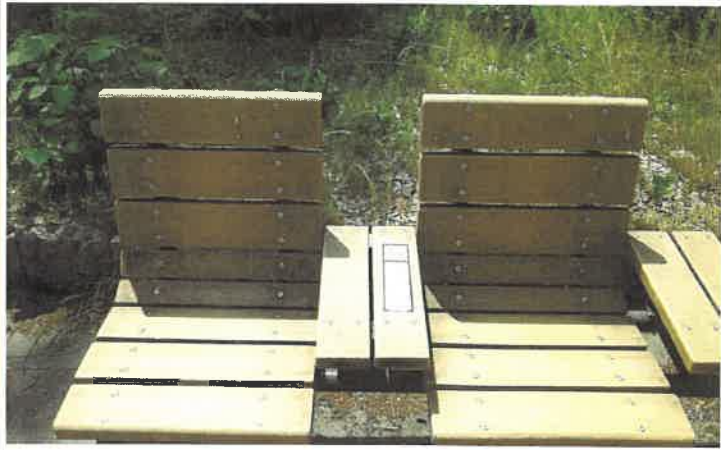
府立医大前ベンチ