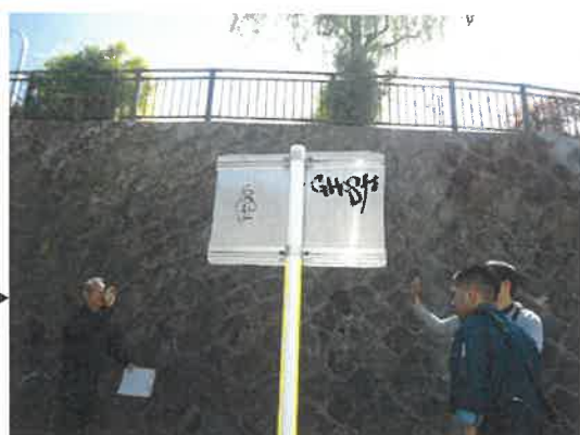
増水への注意を呼びかける注意喚起看板 (同一箇所の写真)