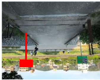
看板 (施工イメージ)