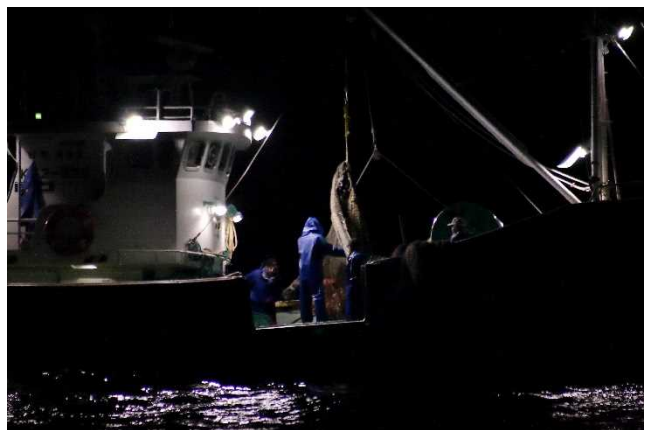
ズワイガニを水揚げしている様子