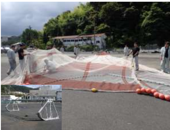
調査に使用した桁びき網

そのため、当センターでは、本年度からアカムツの生態解明と持続的な漁獲方法の開発に取り組んでいます。7～8 月に海洋調査船「平安丸」による桁びき網操業を行い、アカムツが多く分布する水深帯や水温などの環境条件、漁獲サイズなどを調べました。その結果、アカムツの成魚と幼稚魚は同じ場所に生息していると推察され、幼稚魚を保護しつつ成長した魚だけを選択的に漁獲することが重要であると分かりました。今後も調査データを蓄積し、アカムツ資源の持続的な利用方法を提示します。