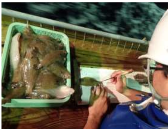
ヤナギムシガレイの体長測定

※桁びき網：鉄枠(桁)に漁網を取り付けた漁具の一種。平安丸で使う桁は幅約 8.5m で網の高さは 1.7m、長さは約 30m に及ぶ。これを海底まで降ろし、一定速度で曳くことにより海底近くにいる生物を漁獲する。