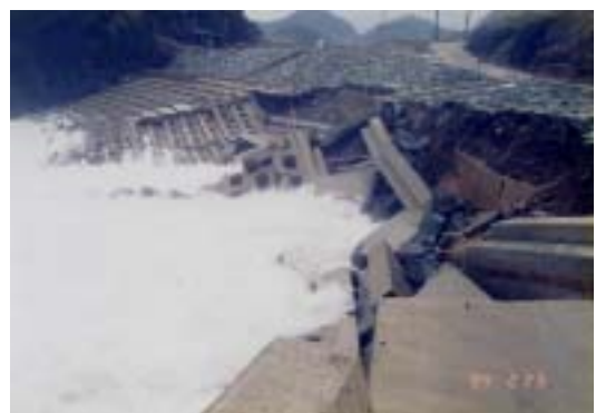
冬季風浪による海岸保全施設の被災

過去に越波などによる大きな被災は発生していないが、冬季風浪などによる海岸保全施設の破損、背後地民家への浸水などが一部で発生している。