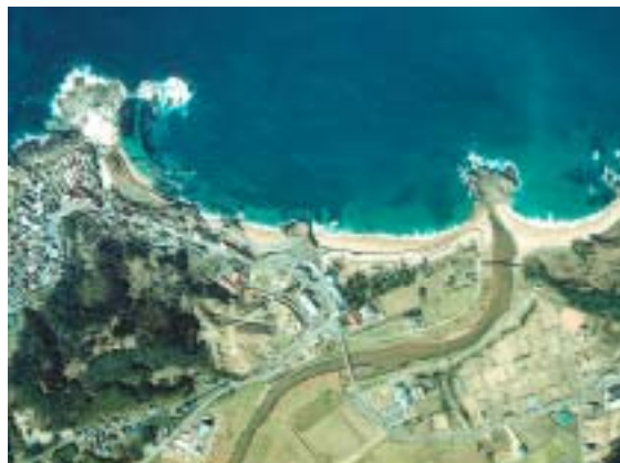
竹野川河口の後ヶ浜海岸

経ヶ岬以西及び栗田、大浦両半島にはこのような弓形ポケットビーチが多く、同様の特性を示している。