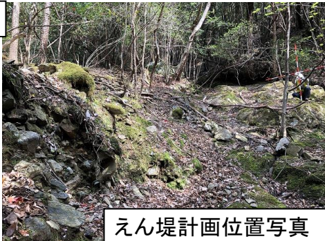
えん堤計画位置写真