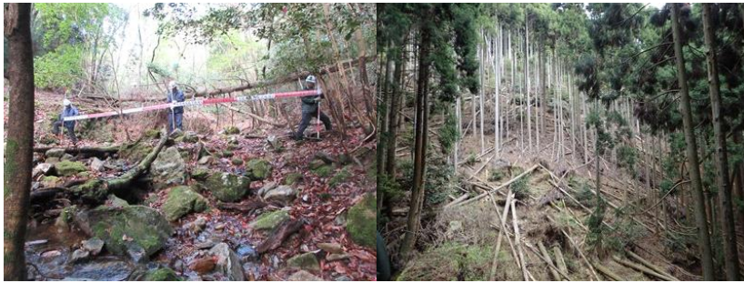
巨礫・倒木により荒廃した渓流