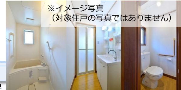
※イメージ写真 (対象住戸の写真ではありません)