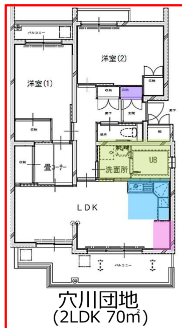
穴川団地 (2LDK 70㎡)