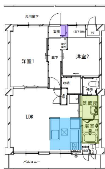
洛西竹の里団地 (2LDK 58㎡)