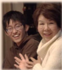
Ⓢ 高齢者(夫婦) 京都市北区在住 Ⓢ 大学生(男性) 奈良県出身

Ⓢ 奈良の実家から大学まで往復3時間を費やしていましたが、ゆっくり朝ご飯が食べられるようになり、学外活動の時間も充実しました。