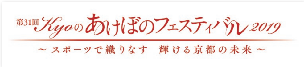
ホール舞台の大看板