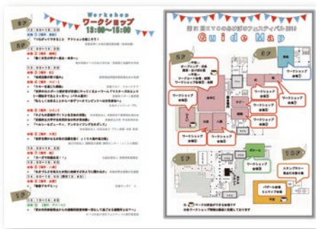
ワークショップチラシ