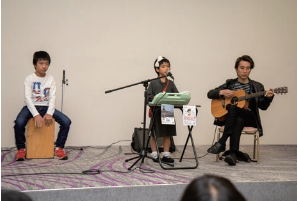
ストロベリーズ ミニライブ