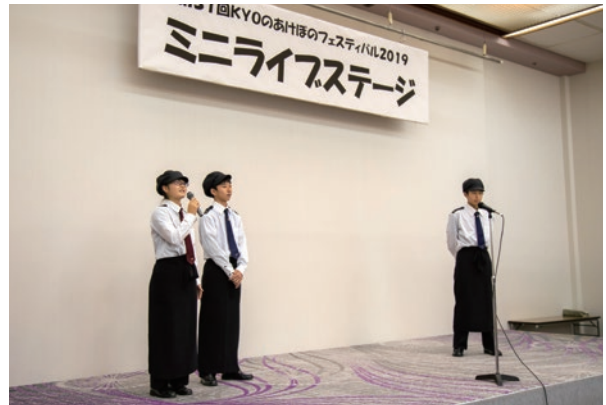
各京都府立高等学校の取組紹介 ・府立海洋高等学校・府立農芸高等学校 ・府立須知高等学校・府立南丹高等学校