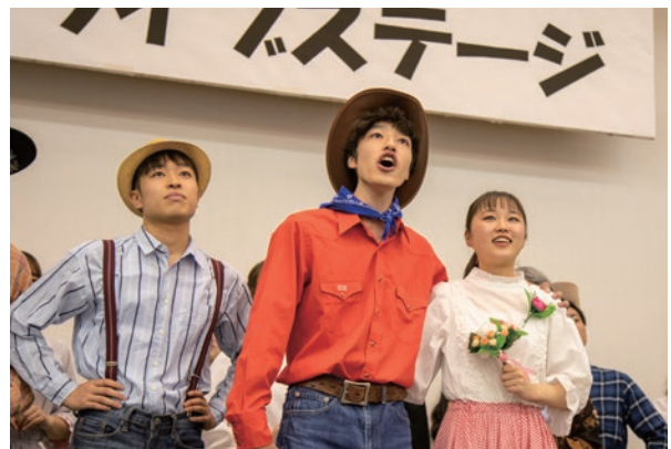
Broadway Musical Showcases 龍谷大学B. W. ミュージカルサークル