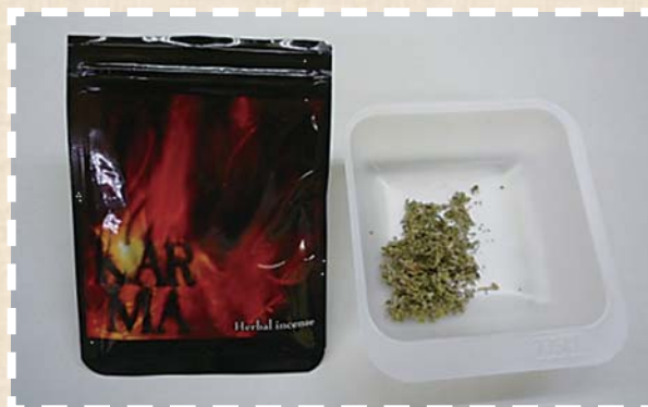
<写真1> 当研究所で検査した危険ドラッグ