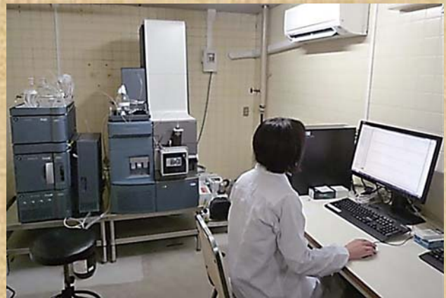
<写真2> 液体クロマトグラフ飛行時間型質量分析計(LC-TOF/MS)