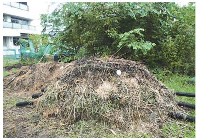
写真2 堆肥化実験：枯れ草で作った山の中に、数10匹のカメが入っています。発酵温度は、約60℃になり、1ヶ月で、甲羅も含めてほぼ分解されます。