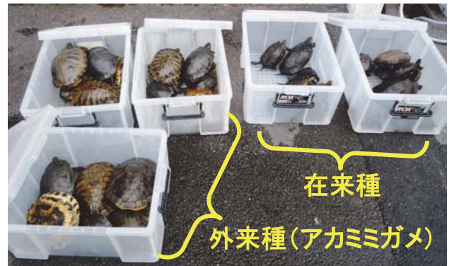
写真1 ため池で捕獲された淡水ガメ。アカミミガメ以外は、個体識別後に元の場所に放流します。

京都府においては、亀岡市以南でアカミミガメの生息が確認されていますが、詳しい調査はなされていません。そこで、水質課では、今年度より府南部のため池群において、本種を含む淡水ガメの生息実