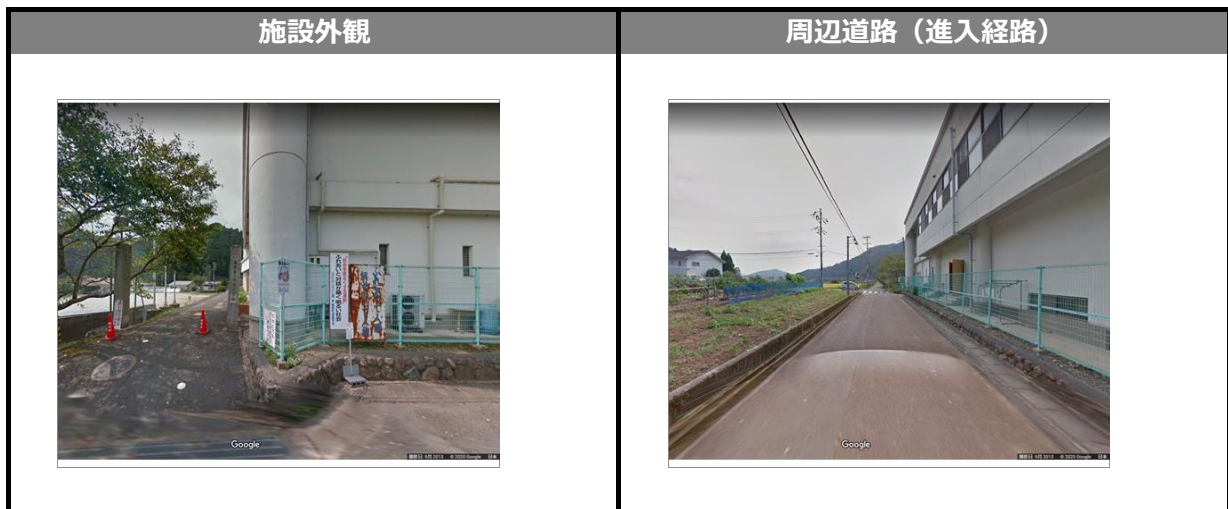
Google ストリートビュー