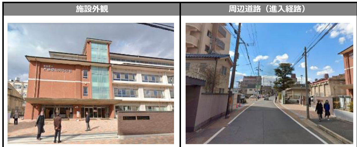
Google ストリートビュー