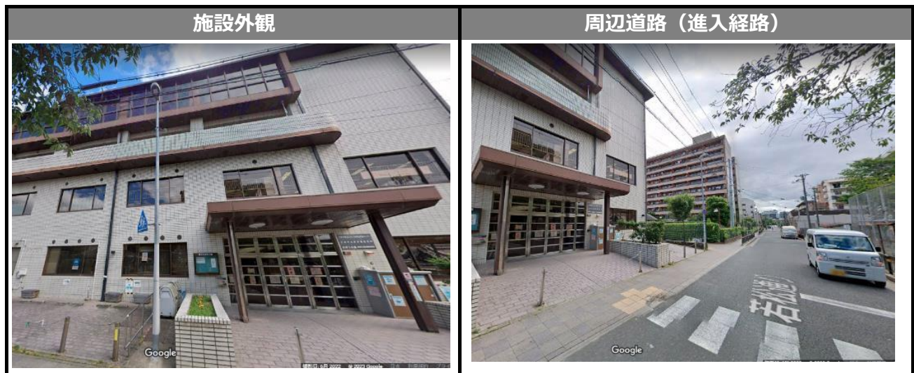
Google ストリートビュー