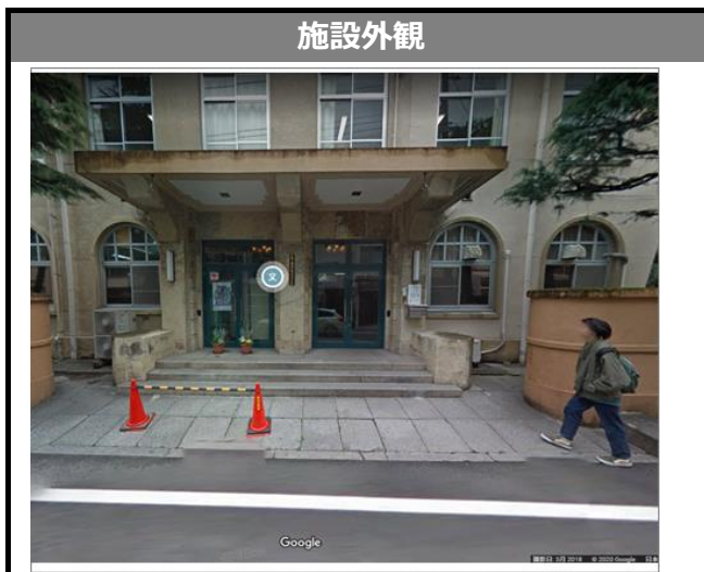
Google ストリートビュー