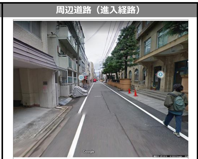
Google ストリートビュー