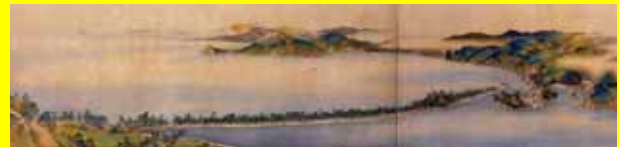
天橋立真景図(部分) 島田雅喬筆 19世紀中頃(江戸時代)