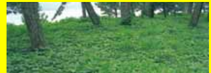
クズが繁茂した松林