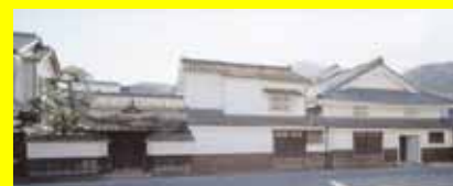
旧三上家住宅(重要文化財指定)

八条宮智忠親王(1619～62)が完成させた桂離宮庭園には、天橋立を模した造形がみられる。