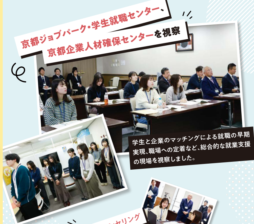
京都ジョブパーク・学生就職センター、 京都企業人材確保センターを視察

学生と企業のマッチングによる就職の早期実現、職場への定着など、総合的な就業支援の現場を視察しました。