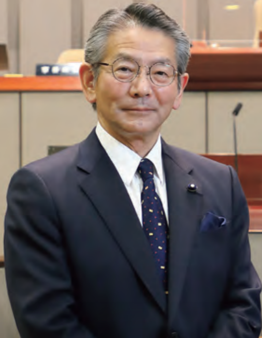
第82代議長 菅谷 寛志

このたび、歴史と伝統ある京都府議会の第82代議長に選出され、身に余る光栄に感謝いたしますとともに、改めて、その重責を感じております。