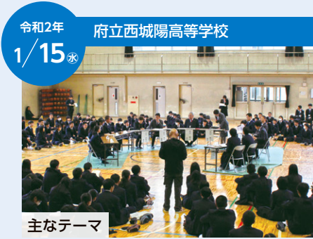
令和2年 1/15 府立西城陽高等学校