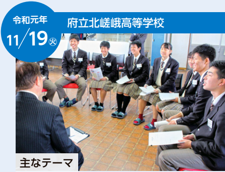
令和元年 11/19 府立北嵯峨高等学校