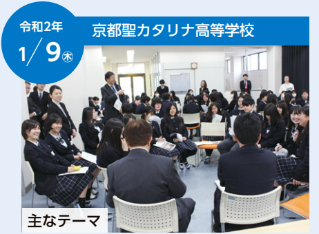
令和2年 1/9 京都聖カタリナ高等学校