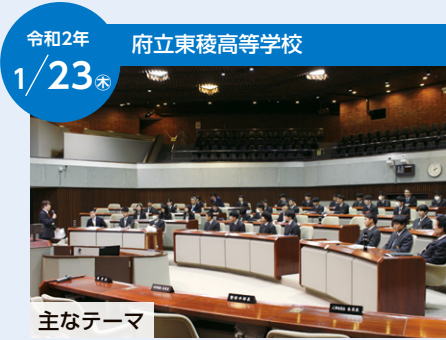
令和2年 1/23 府立東稜高等学校