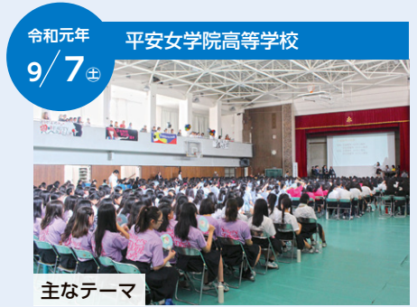
令和元年 9/7 平安女学院高等学校