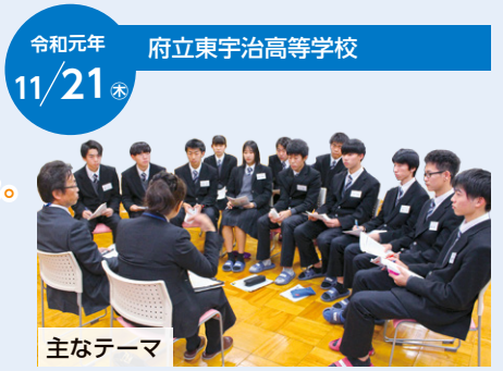
令和元年 11/21 府立東宇治高等学校