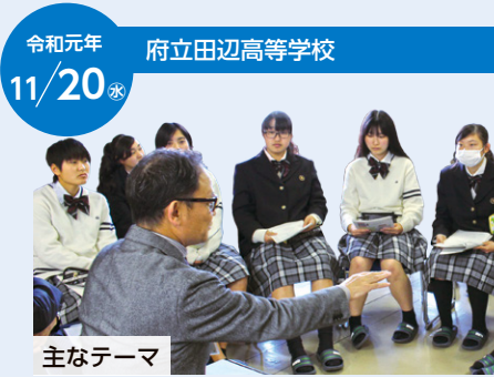
令和元年 11/20 府立田辺高等学校