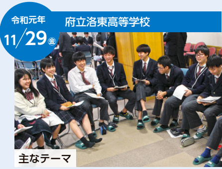
令和元年 11/29 府立洛東高等学校