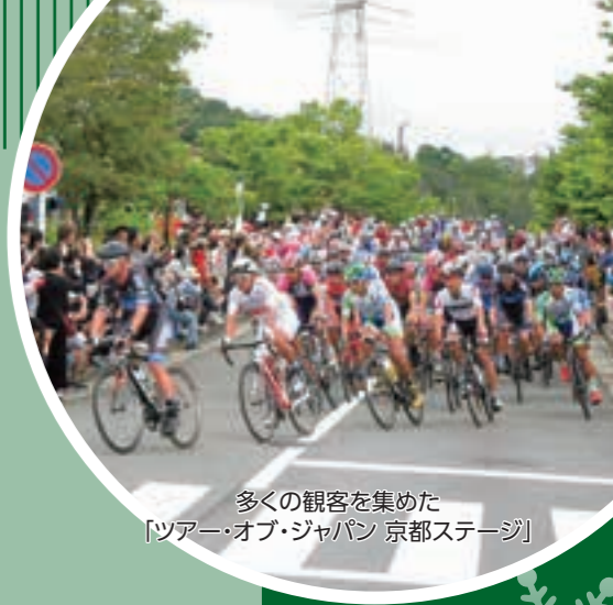
多くの観客を集めた「ツアー・オブ・ジャパン 京都ステージ」