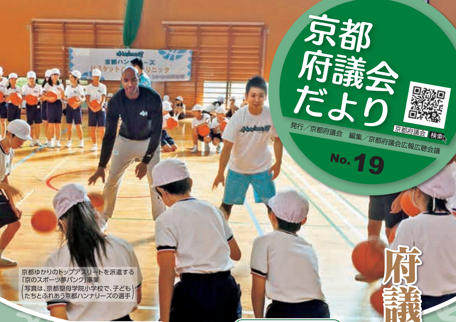
京都ゆかりのトップアスリートを派遣する「京のスポーツ夢バンク」事業 (写真は、京都聖母学院小学校で、子どもたちとふれあう京都ハンナリーズの選手)

府議会でスポーツについて審議しているからかな？ どんな審議をしているのか見てみましょう！