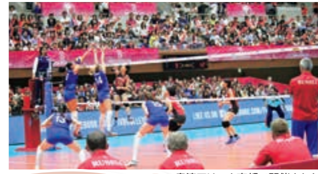
島津アリーナ京都で開催された「ワールドグランプリ2016」

積極的に国際大会の誘致に取り組んで、子どもたちに 一流のプレーを見る機会 をつくってほしい