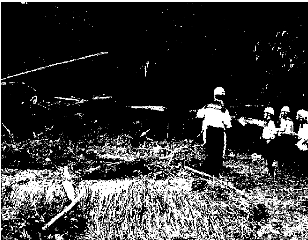
福知山市笹場地域において、ため池・山崩れの状況について調査しました