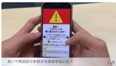
啓発動画「フィッシング詐欺」

※CYCOTとは、「Cyber Youth Cooperation Team」の略で頭文字をとったもの