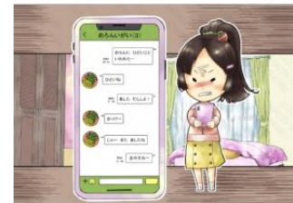
「ともだちとトラブル」