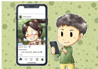
「かかってにそうしん」