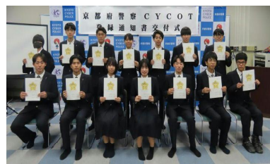
京都府警察CYCOT登録通知書交付式