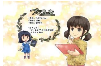
「ネットのともだちと」