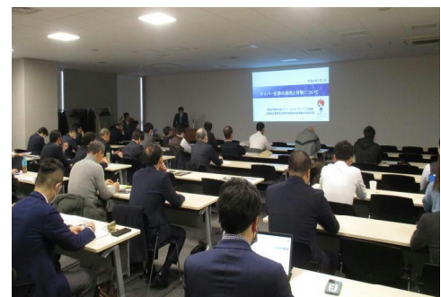
中小企業向け情報セキュリティ対策セミナー

その他、府警のホームページやメールマガジンを活用した被害防止に関する情報発信等、様々な機会を通じて情報セキュリティ対策を推進している。