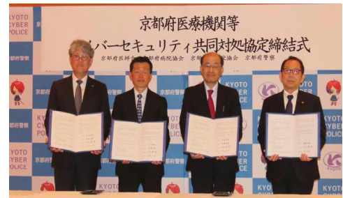
京都府医療機関等サイバーセキュリティ共同対処協定締結式

医療機関におけるランサムウェア等のサイバー犯罪・サイバー攻撃に係る被害の未然防止及び発生時における警察への迅速な通報・相談を促進するため、本年5月15日、医療関係団体（京都府医師会、京都府病院協会及び京都私立病院協会）と共同対処協定を締結した。