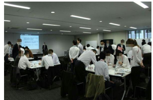
医療関係団体との共同対処訓練

行政機関、金融、鉄道等の重要インフラ事業者や先端技術保有企業に対するサイバー攻撃被害の未然防止を図るため、注意喚起や対処能力の向上を目的とした個別訪問や共同対処訓練を推進し、令和5年中、個別訪問 257件、共同対処訓練19件を実施した。