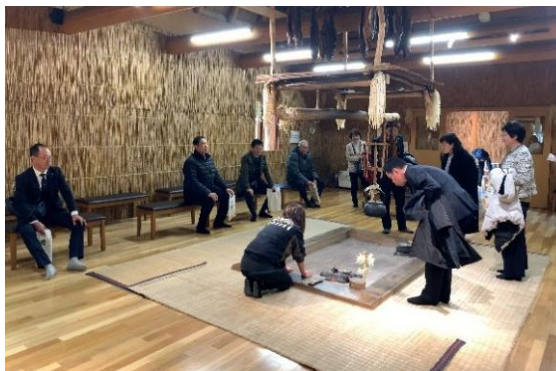
伝統的コタンを視察