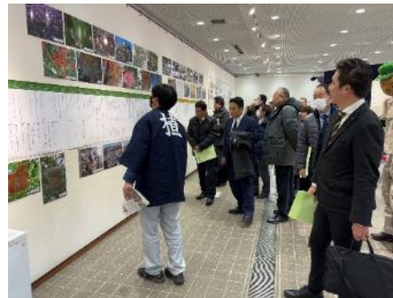
開園100年の歩み展を視察