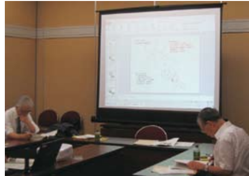
専門家による会議で補助事業の選定を行います