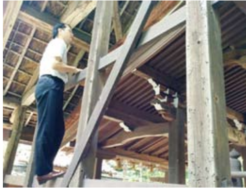
現地調査で文化財の状態を確認します

選定した事業の内容や取組結果については、ホームページや「文化財通信」誌面で御報告させていただきます。