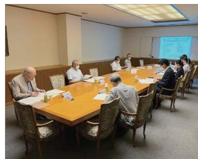
専門家による会議で補助事業の選定を行います。