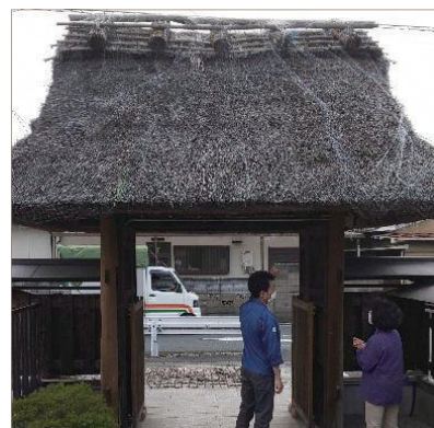
現地調査で文化財の状態を確認します。