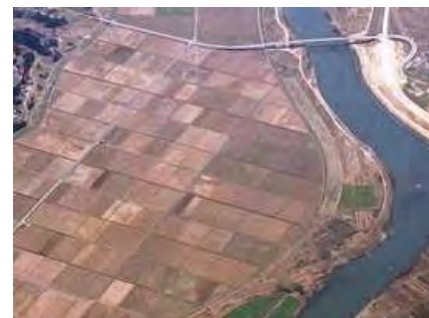
（事業後）大区画化・整形した農地