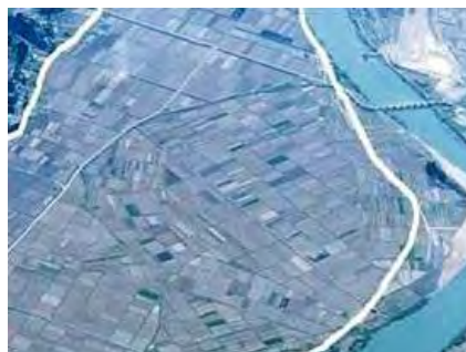
（事業前）小規模で不整形な農地

地域全体の一体的な農地整備によって、労働・土地生産性が向上し、併せて担い手への農地集積や高収益作物の導入を図ることで、競争力ある農業の実現に寄与します。