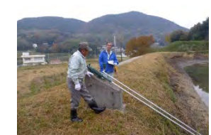
ため池の現地パトロール