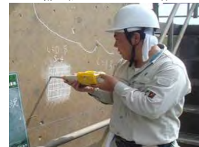
老朽化した施設の機能診断