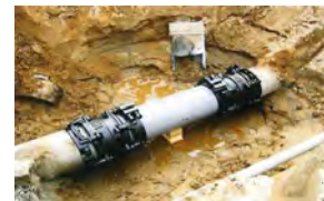
漏水防止のための整備