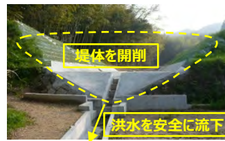
洪水を安全に流下 ため池の廃止