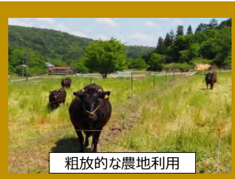
粗放的な農地利用