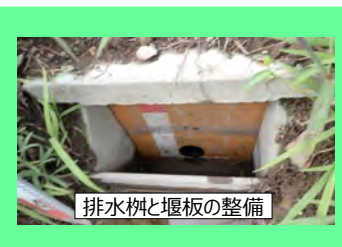
排水柵と堰板の整備

(ソフト) 「田んぼダム」実施に向けた地元調査・調整経費、堰板購入等 (単年度当たり300万円迄)、条件改善促進支援 (定率) 等