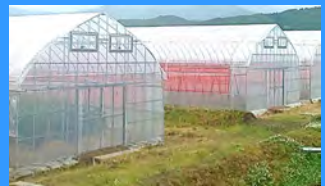
高付加価値農業施設の設置