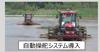
自動操舵システム導入