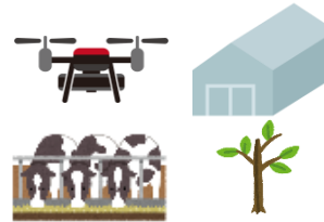
機械・施設、家畜、苗木等の購入費