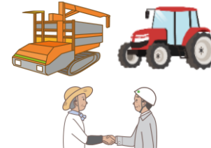
農業用機械のリース費