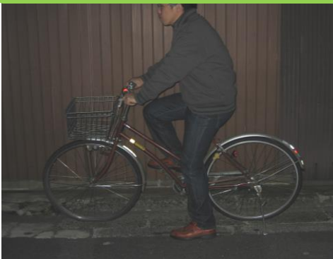
反射材をつけていないとき