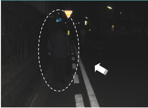
反射材をつけていないとき