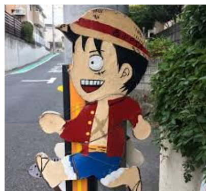
続 茨木市立西小 飛び出し坊や