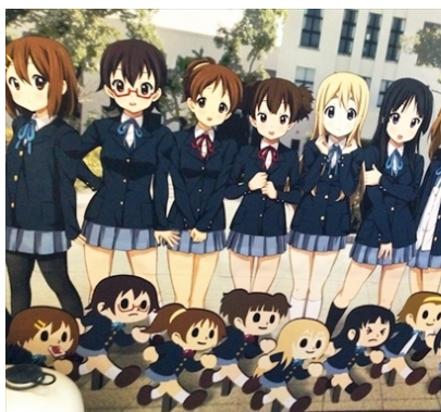
“飛び出し坊や”発祥の地へ！ 変わり種看板を探してきた-オモトピア http://ure.pia.co.jp/articles/-/27937?page=4