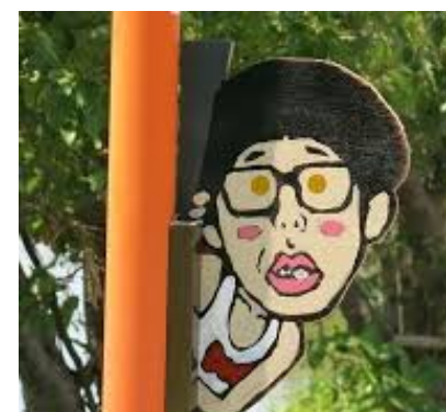
Posts tagged as #滋賀県発祥Picpanzee http://picpanzee.com/tag/%e6%bb%8b%e8%b3%80%e7%9c%8c%e7%99%ba%e7%a5%a5