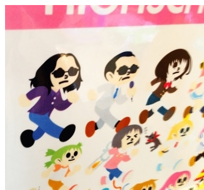
“飛び出し坊や”発祥の地へ！ 変わり種看板を探してきた-オモトピア http://ure.pia.co.jp/articles/-/27937?page=4