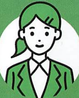
少年非行防止学生ボランティア「KYO-SOLEIL」Dさん

心から寄り添っていただき、息子が 真面目に学校へ行くようになりました。 本当にありがとうございます。