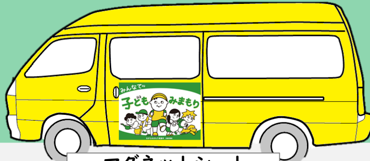
マグネットシート

国立大学法人京都工芸繊維大学 中野デザイン研究室と協働し、 これまでもグッズを製作