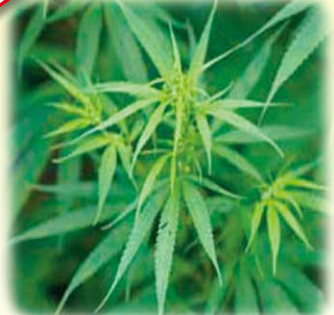
(写真は、大麻草の一例です。)

覚醒剤110番 TEL 075-451-7957 ヤングテレホン TEL 075-551-7500