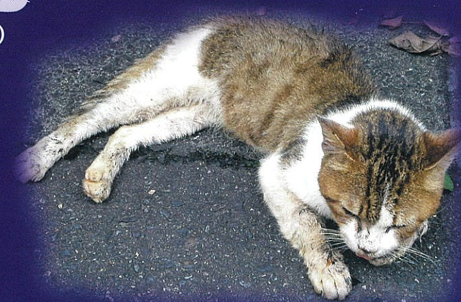
路上で倒れている病気の猫