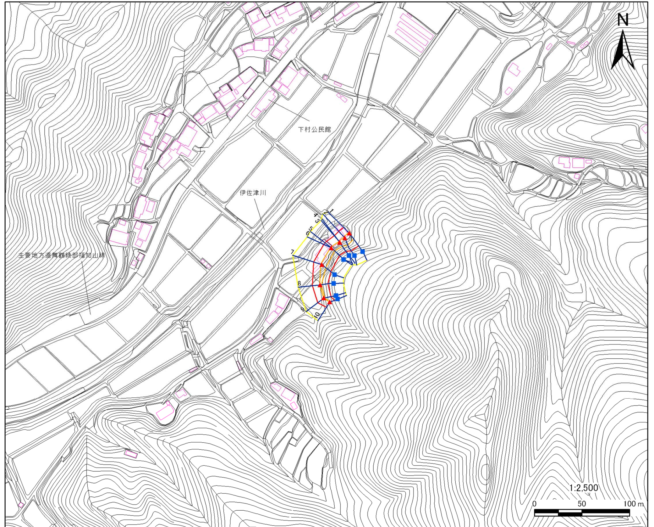
土砂災害警戒区域・土砂災害特別警戒区域 区域図