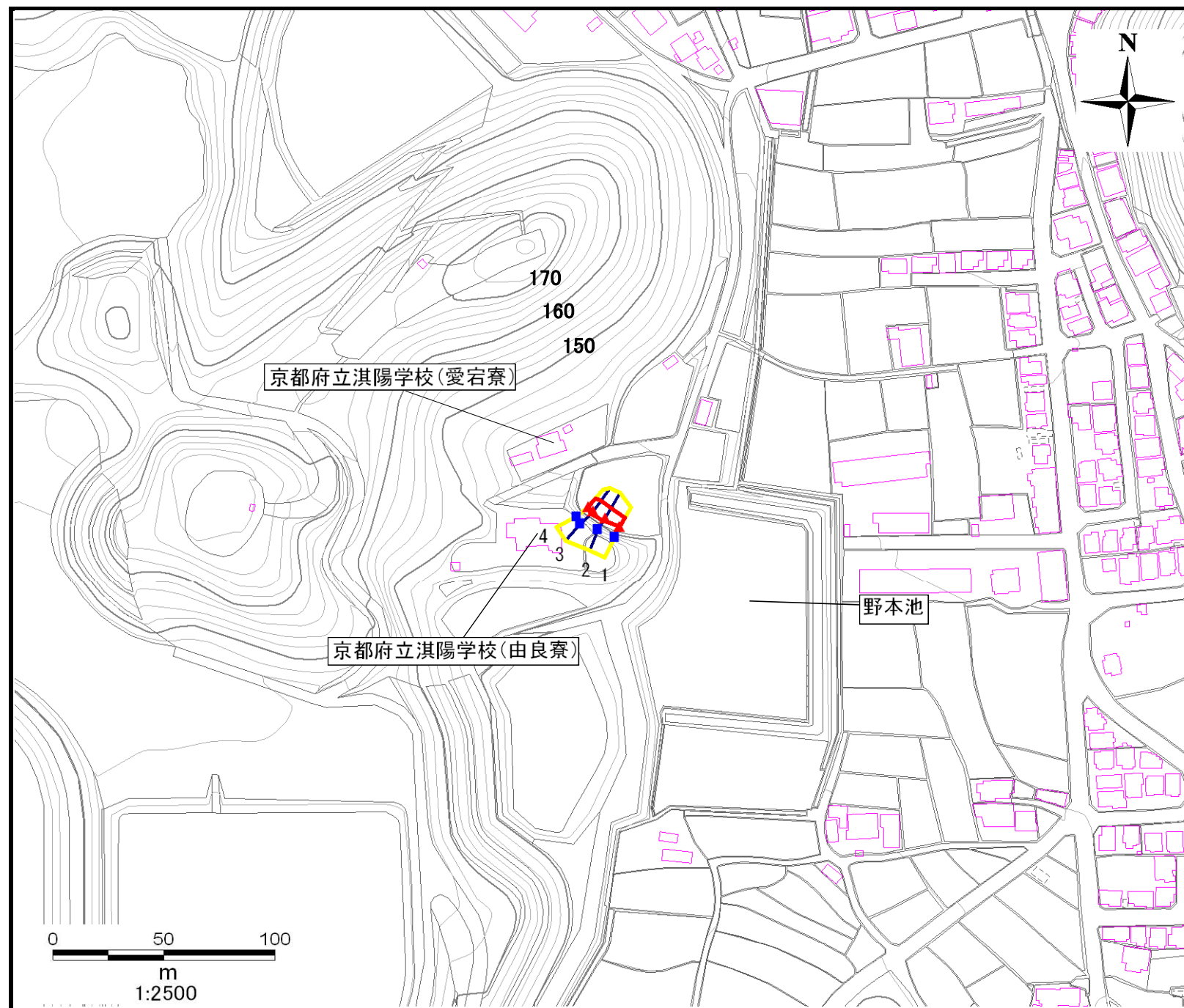
土砂災害警戒区域・土砂災害特別警戒区域 区域図