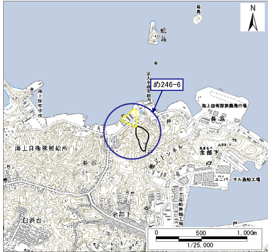
土砂災害警戒区域・土砂災害特別警戒区域 位置図

・この地図は、国土地理院長の承認を得て、同院発行の数値地図25000(地図画像)を複製したものである。(承認番号 平25情複、第452号)