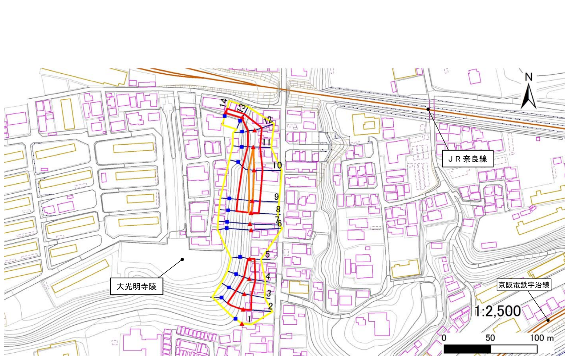
土砂災害警戒区域・土砂災害特別警戒区域 区域図

この地図は、国土地理院長の承認を得て、同院発行の地図25000(地図画像)を複製したものである。 (承認番号 平22業複、第580号)