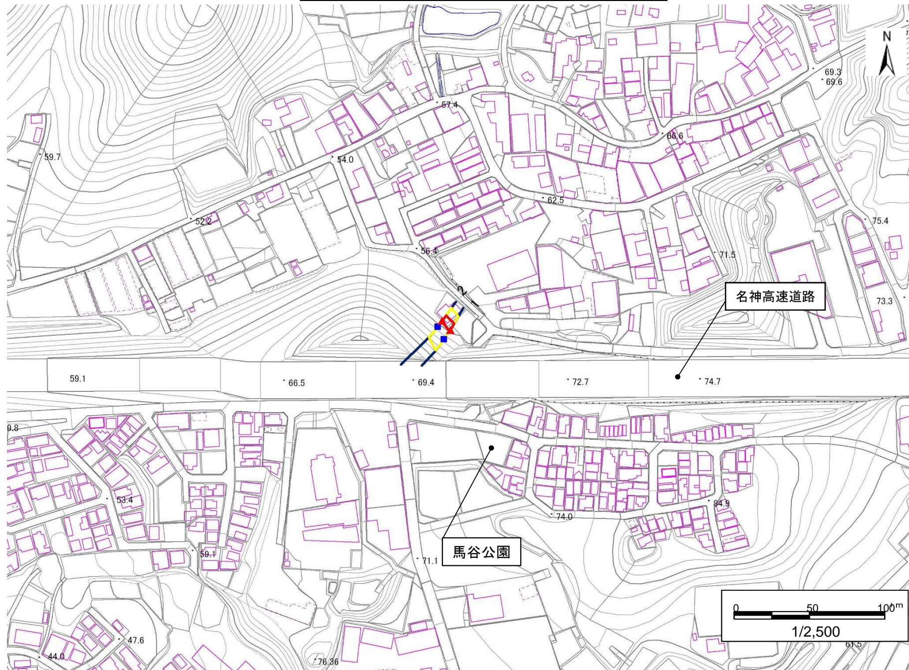
土砂災害警戒区域・土砂災害特別警戒区域 区域図

この地図は、国土地理院長の承認を得て、同院発行の数値地図25000(地図画像)を複製したものである。 (承認番号 平22業複、第580号)