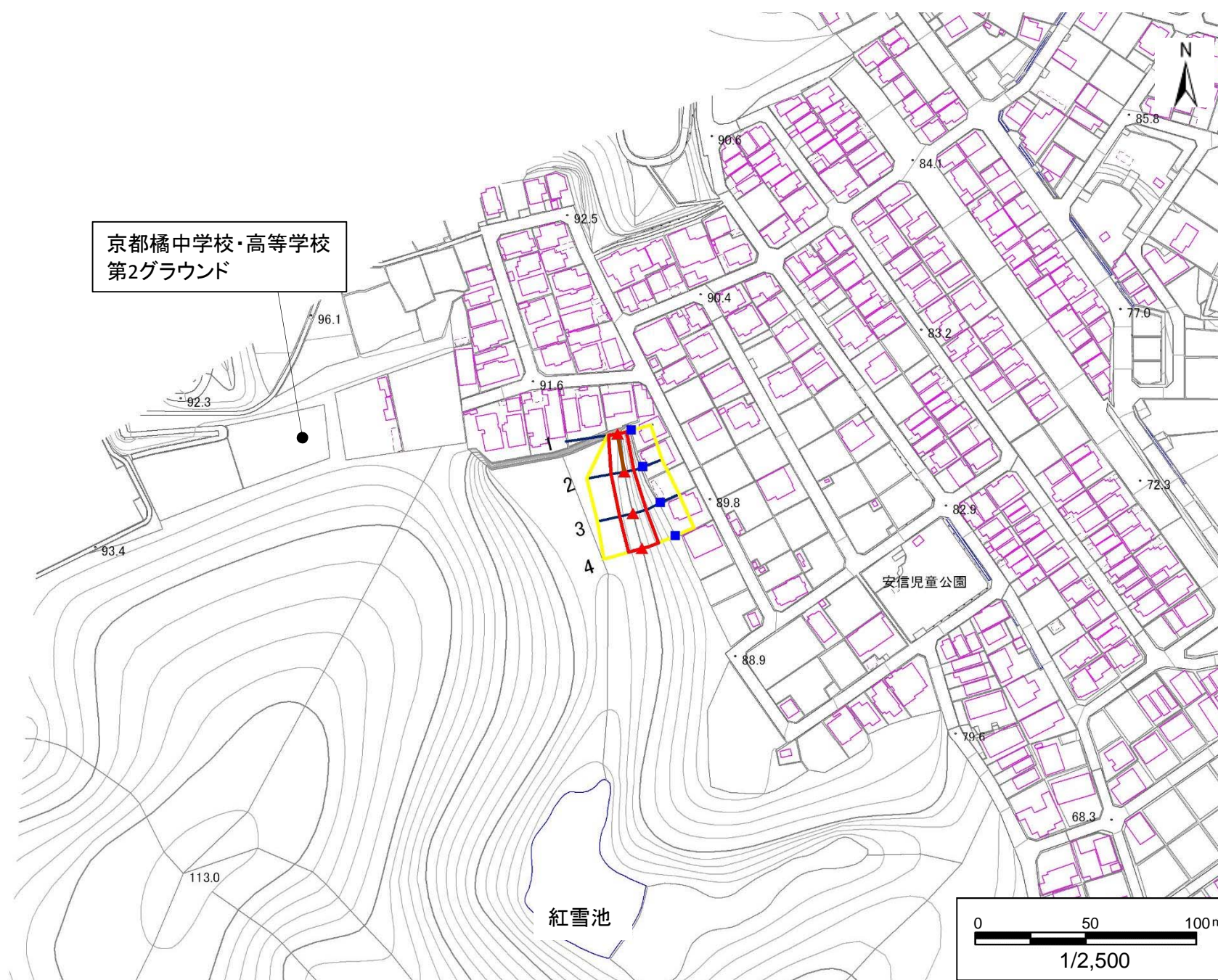
土砂災害警戒区域・土砂災害特別警戒区域 区域図

この地図は、国土地理院長の承認を得て、同院発行の数値地図25000(地図画像)を複製したものである。 (承認番号 平22業複、第580号)