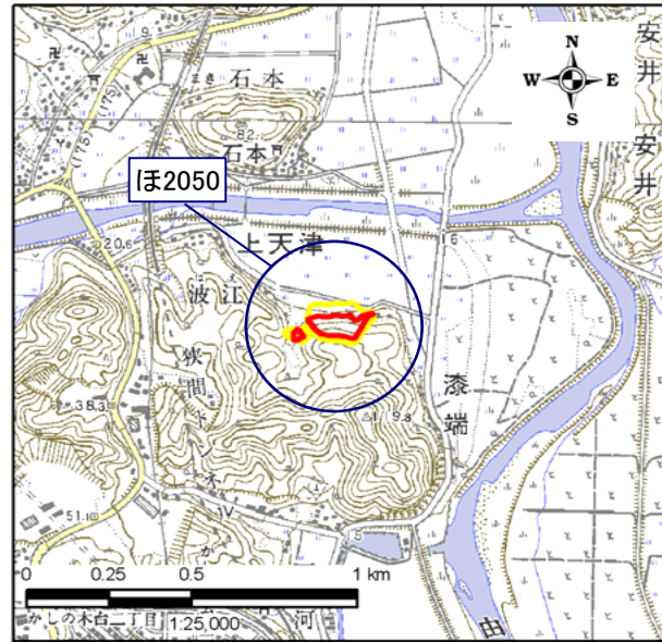
土砂災害警戒区域・土砂災害特別警戒区域 位置図

・この地図は、国土地理院長の承認を得て、同院発行の 数値地図25000(地図画像)を複製したものである。 (承認番号 平22業複、第580号)