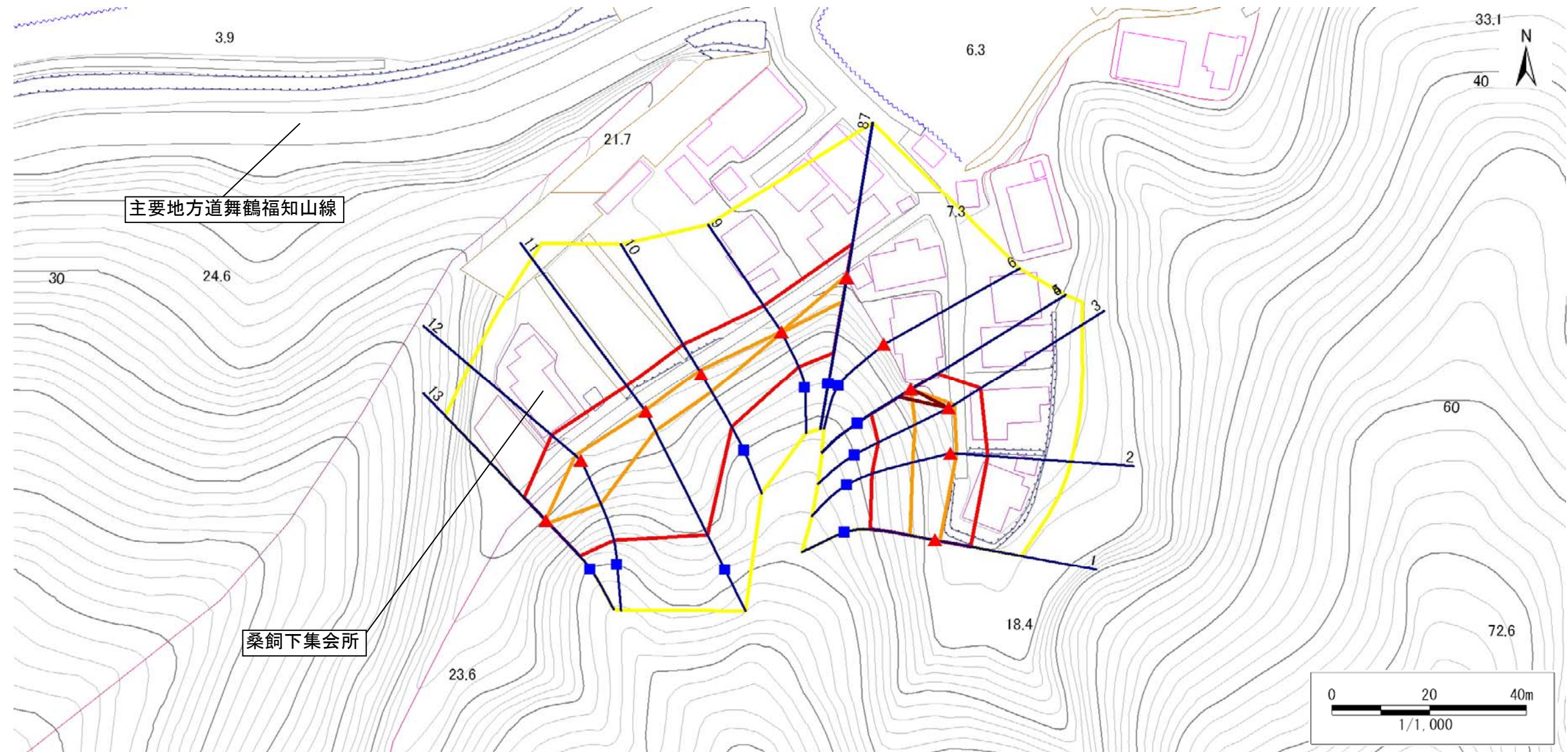
土砂災害警戒区域・土砂災害特別警戒区域 区域図(参考図)