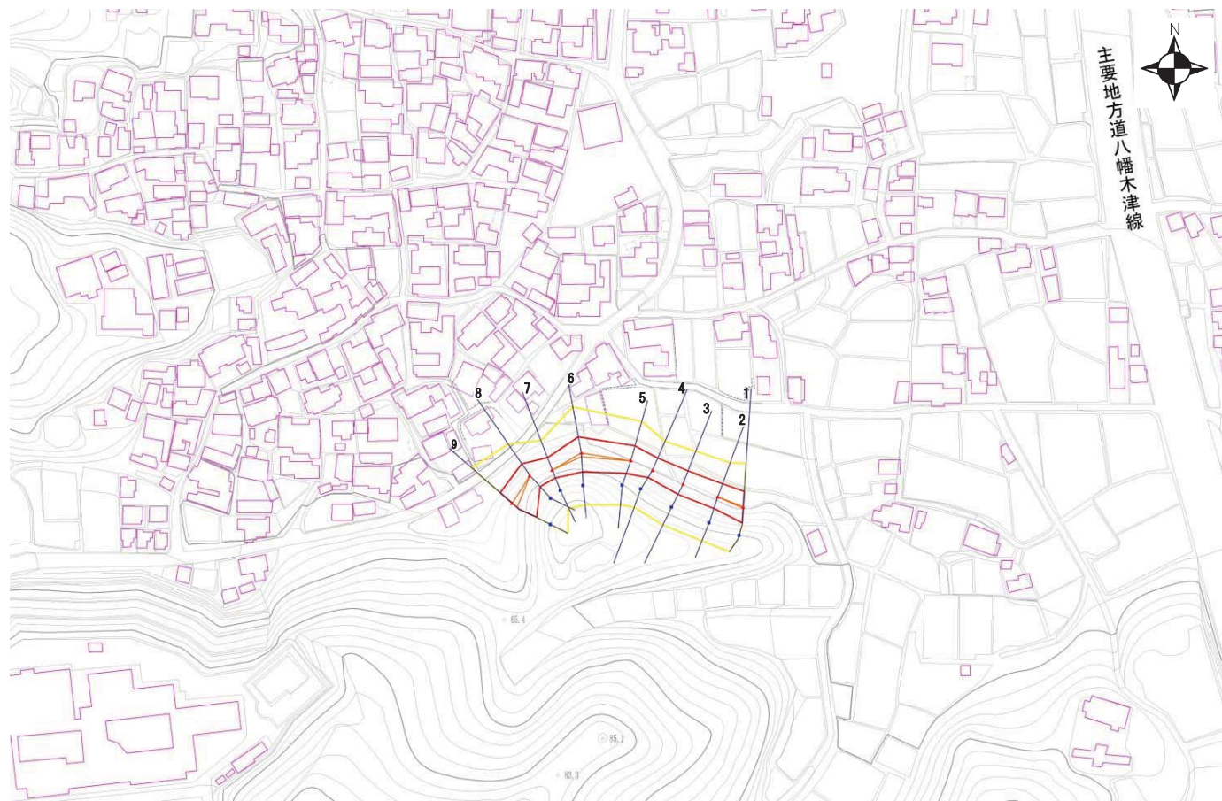
土砂災害警戒区域・土砂災害特別警戒区域 区域図