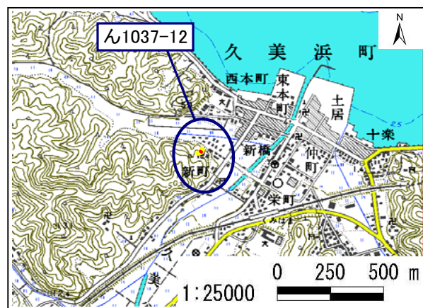
土砂災害警戒区域・土砂災害特別警戒区域 位置図

・この地図は、国土地理院長の承認を得て、同院発行の数値地図 25000(地図画像)を複製したものである。(承認番号 平19総複、第1082号)